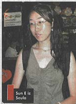
Sun E iz Seula